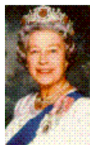
La Reine Elisabeth II